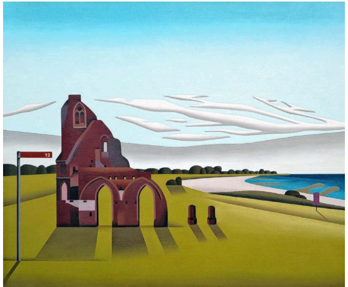
Klosterruine Eldena an der Ostsee, 2024.

© courtesy Galerie Poll, Berlin / Jan Schüler/VG Bild-Kunst, Bonn 2026 (4).