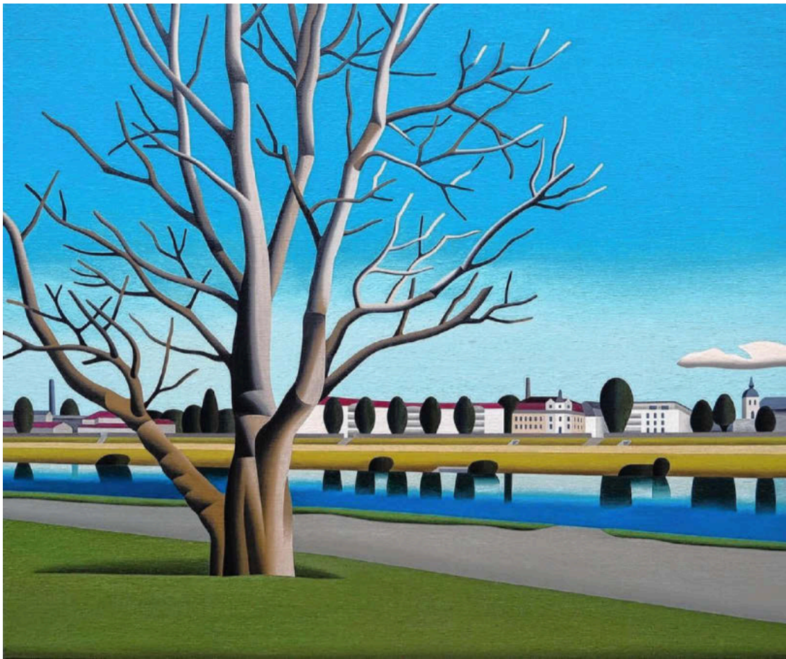
Dresden: Blick vom Ostragehege, 2025.